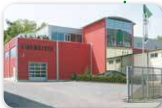
Hochregallager mit Verwaltung